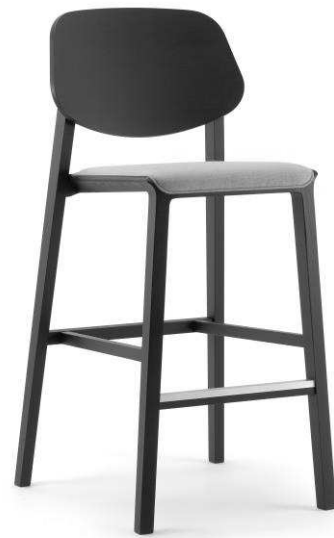
Dimensioni / Sizes (cm) A

Poetic essence. The design for this stackable seat seeks out the ideal combination of lightness and sturdiness, practicality and elegance, comfort and compactness. The solution is a versatile proposal that is both distinctive and original, with large upholstered surfaces, framed by a skilfully prepared slender solid wood frame. Also available in chair and armchair.