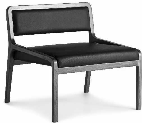
Dimensioni / Sizes (cm) A

Simply elegant. The essential, rounded lines of this lounge chair make for an unmistakable design, solid yet light, with a distinctive broad seat and elegant legs that create a visual immediacy, emphasising the quality of the materials and production processes. Versatile in the choice of possible settings and uses, they fit seamlessly into a vast range of domestic and collective spaces. Also available in chair, armchair and barstool versions.