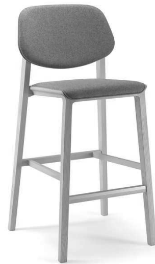
Dimensioni / Sizes (cm) A

Poetic essence. The design for this stackable seat seeks out the ideal combination of lightness and sturdiness, practicality and elegance, comfort and compactness. The solution is a versatile proposal that is both distinctive and original, with large upholstered surfaces, framed by a skilfully prepared slender solid wood frame. Also available in chair and armchair.