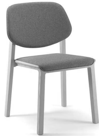
Dimensioni / Sizes (cm) A

A. Le dimensioni indicate rappresentano il massimo ingombro dell'oggetto. B. Il consumo di tessuto è valido per stoffa o ecopelle in tinta unita, rotoli di altezza 140 cm.