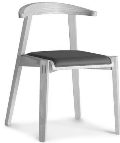
Dimensioni / Sizes (cm) A

Sedile: disponibile due versioni: con legno a vista oppure tappezzato in varie combinazioni di tessuto pelle od ecopelle, selezionabili dal catalogo Cizeta oppure forniti dal cliente. Imbottitura con poliuretano espanso.