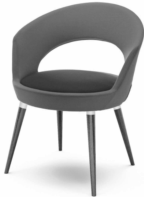
Dimensioni / Sizes (cm) A

Rivestimento: Disponibile in varie combinazioni di tessuto pelle od ecopelle, selezionabili dal catalogo Cizeta oppure forniti dal cliente. Il sedile è tappezzato con l'utilizzo di cinghie elastiche per garantire il migliore comfort. Imbottitura con poliuretano espanso.