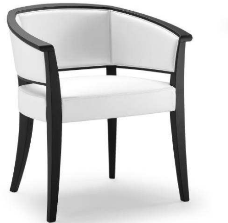
Dimensioni / Sizes (cm) A

Surrounded by care and attention. Produced with craftsmanlike skill and attention to every detail, this chair features snug lines and soft upholstery to envelop the body. Its elegant and reassuring presence in bedrooms at home or in hotels, as well as in warm and welcoming contract settings.