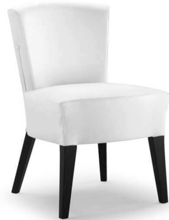
Dimensioni / Sizes (cm) A

Simple stardom. Designed to suit reception spaces, with a simple yet incisive style, with feature clean lines and imposing thicknesses, but always neat and tasteful. These characteristics enable it to be used in a vast range of situations, from waiting rooms to hotel rooms to restaurants. Also available in armchair version.