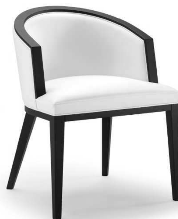
Dimensioni / Sizes (cm) A

A. Le dimensioni indicate rappresentano il massimo ingombro dell'oggetto. B. Il consumo di tessuto è valido per stoffa o ecopelle in tinta unita, rotoli di altezza 140 cm.