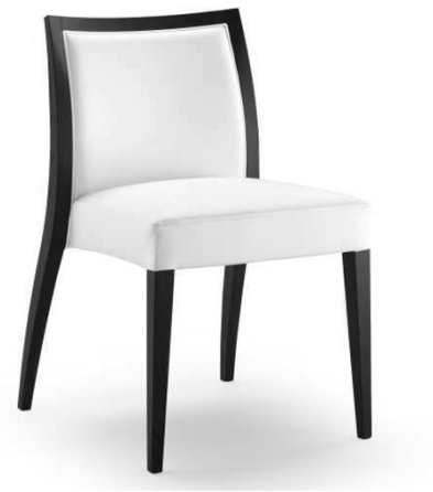
Dimensioni / Sizes (cm) A

A. Le dimensioni indicate rappresentano il massimo ingombro dell'oggetto. B. Il consumo di tessuto è valido per stoffa o ecopelle in tinta unita, rotoli di altezza 140 cm.