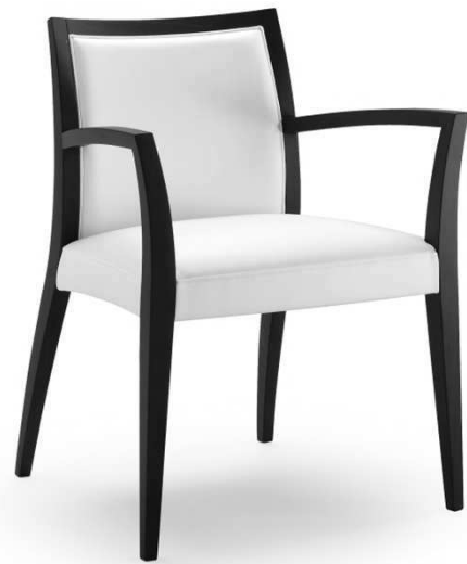
Dimensioni / Sizes (cm) A

Dynamic seating. By crossing different surfaces and volumes, this model was created, inspired by the dual idea of visual movement and soft relaxation, thanks to the ergonomic lines of the chunky upholstered seat. Also available in stackable chair and armchair with upholstered sides versions.