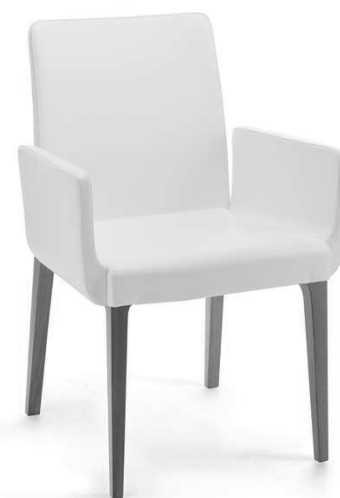
Dimensioni / Sizes (cm) A

B. Il consumo di tessuto è valido per stoffa o ecopelle in tinta unita, rotoli di altezza 140 cm.