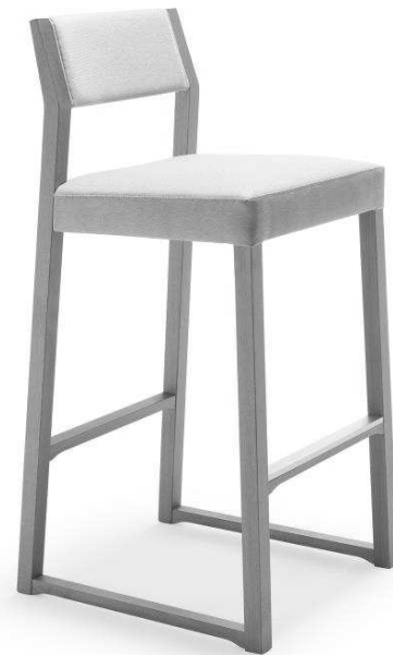
Dimensioni / Sizes (cm) A

B. Il consumo di tessuto è valido per stoffa o ecopelle in tinta unita, rotoli di altezza 140 cm.