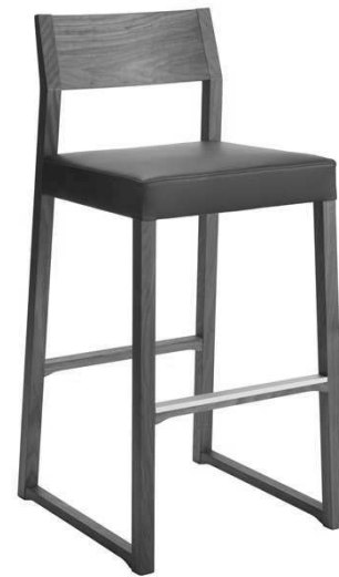
Dimensioni / Sizes (cm) A

B. Il consumo di tessuto è valido per stoffa o ecopelle in tinta unita, rotoli di altezza 140 cm.